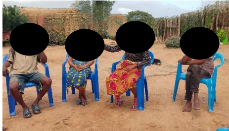
Figura 3. Alguns membros da comunidade San da localidade da Hupa/Cacula – Angola.

Desta feita, tem-se as imagens de alguns membros San.