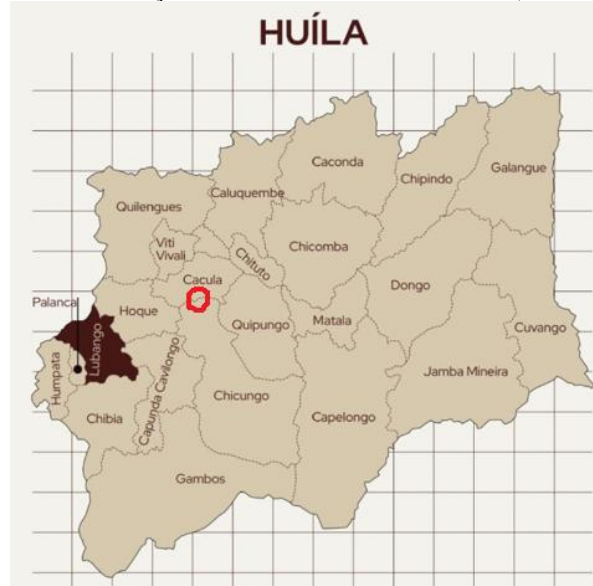
Figura 2. Local de concentração da comunidade San na Huíla (assinalado a vermelho)

Desta feita, apresenta-se as duas comunidades da Derruba e da Húpa dos municípios de Chicungo e da Cacula, respectivamente, na província da Huíla.