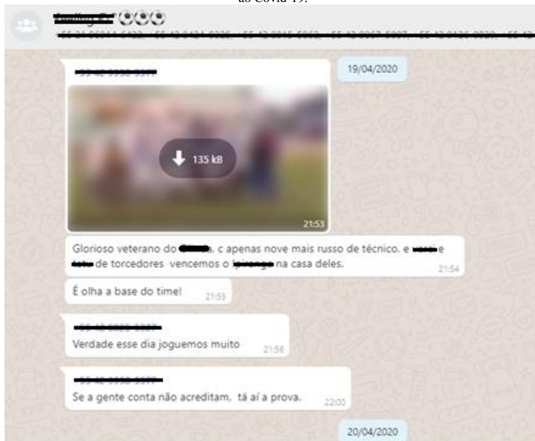
Figura 2 - Agentes que fazem parte do Mirante Esporte Clube, compartilhando fotos antigas e lembrando jogos marcantes em suas memórias, após mais de um mês de paralização da prática do futebol em Ponta Grossa, devido ao Covid-19.