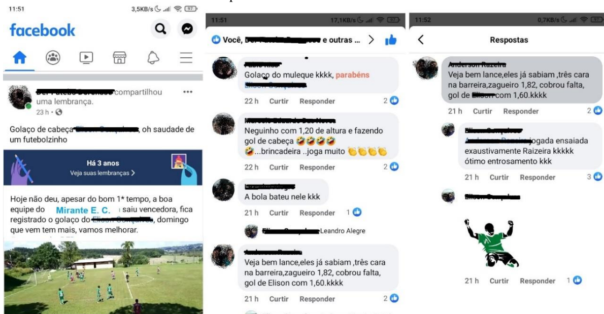
Figura 3 - Interação dos jogadores do Mirante Esporte Clube, em um poste do jogador do Clube de Vila, que relembra uma partida realizada entre os clubes há três anos.