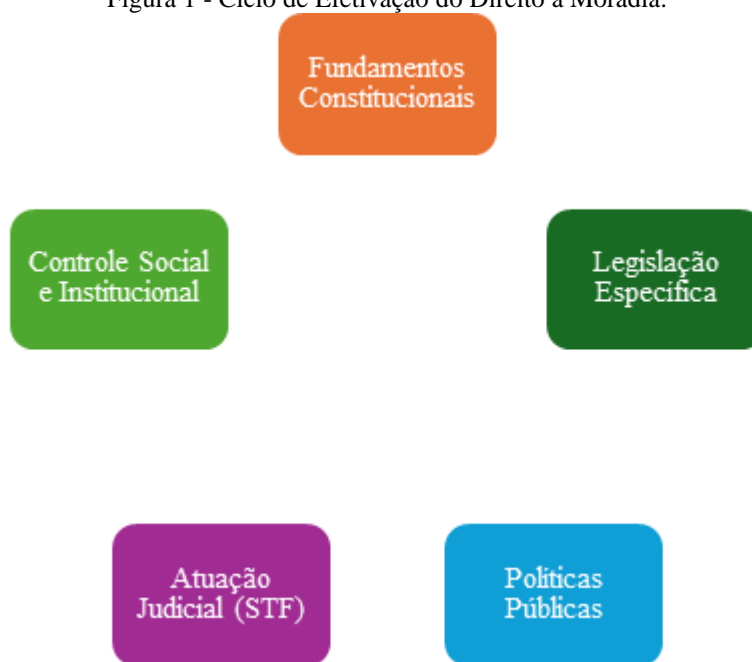
Figura 1 - Ciclo de Efetivação do Direito à Moradia.

A consolidação do direito à moradia exige a articulação efetiva entre os marcos constitucionais e a implementação concreta de políticas públicas sensíveis às especificidades territoriais e sociais dos sujeitos de direito. Esse processo demanda, além da vontade política, o fortalecimento das capacidades institucionais, a ampliação dos mecanismos de controle social e a atuação ativa do Poder Judiciário na promoção dos direitos fundamentais, de modo a assegurar que a moradia não permaneça apenas como uma promessa normativa, mas se realize como condição efetiva de cidadania e dignidade.